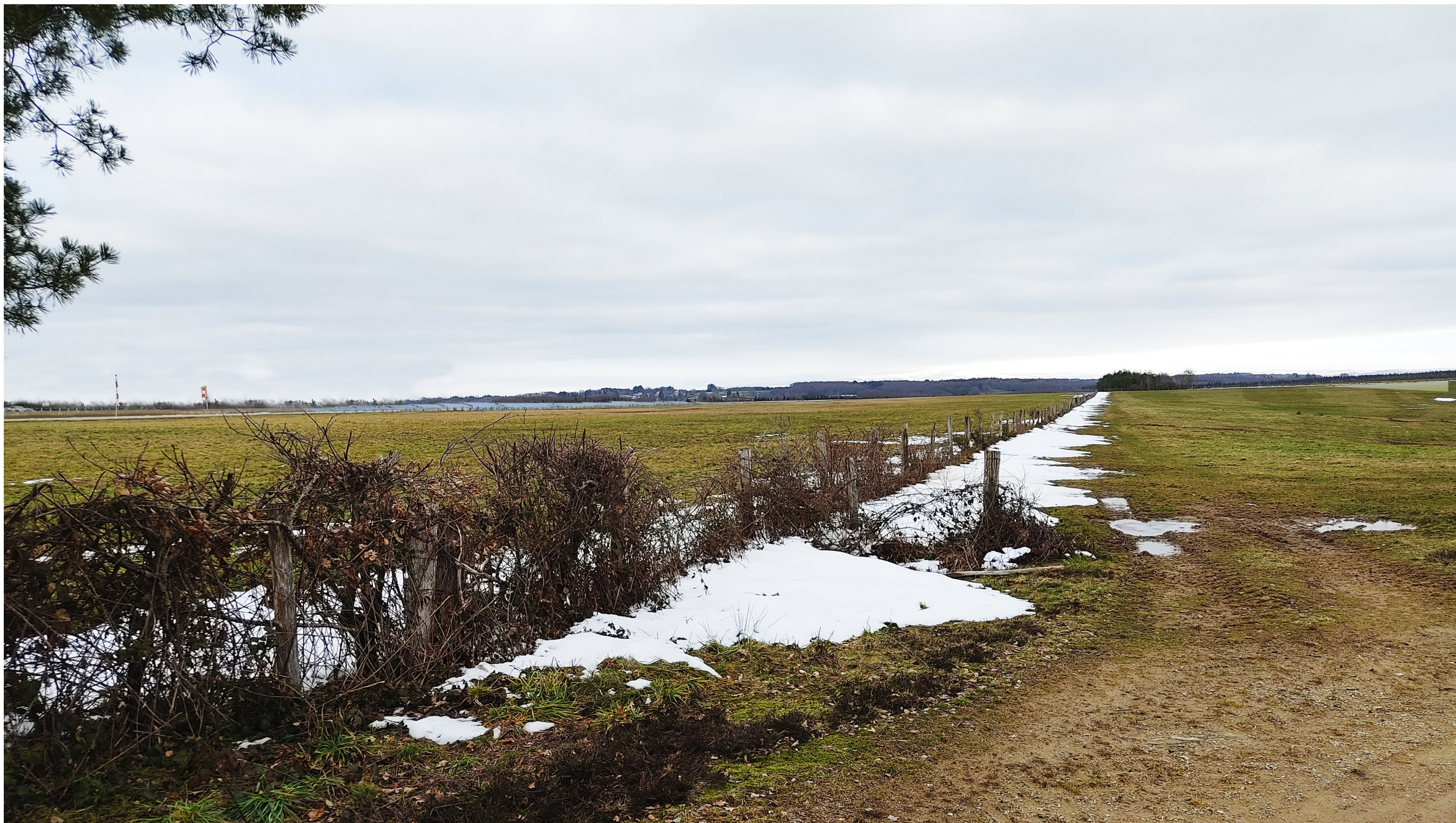
Point de vue N°4- depuis le chemin de randonnée au sud-ouest de l'AEI