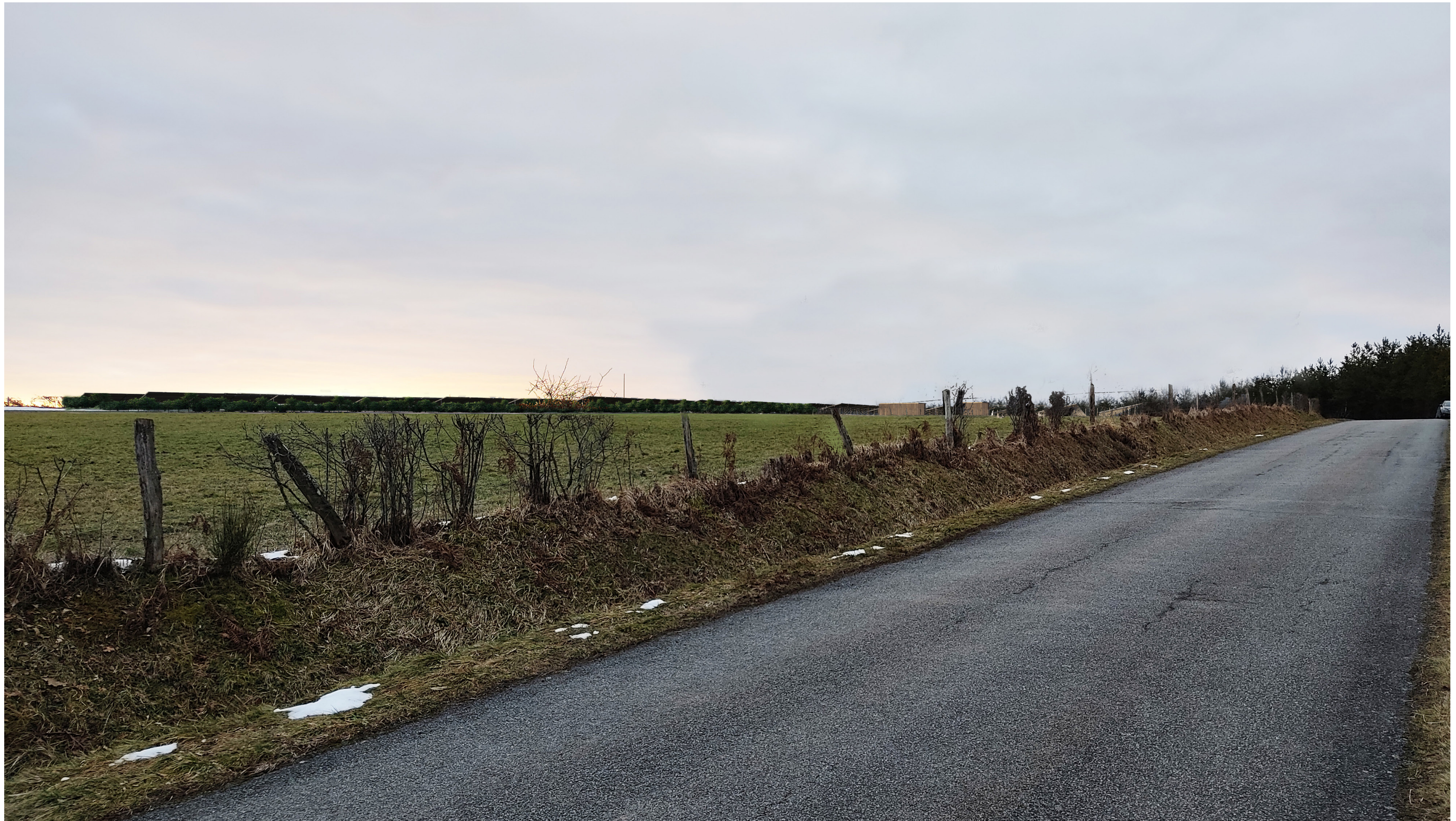
Point de vue N°6 avec végétation- depuis la route départementale n°105