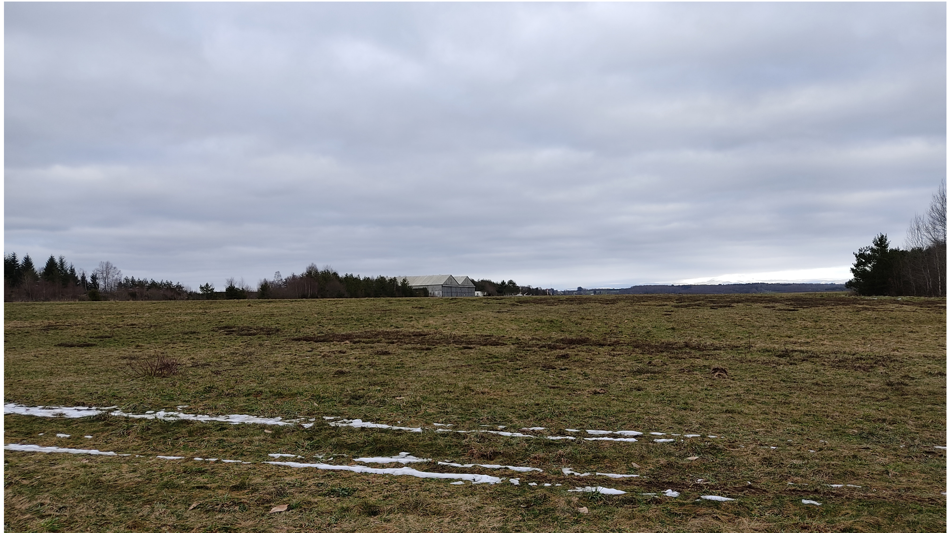
Point de vue N°4- depuis le chemin de randonnée au sud-ouest de l'AEI