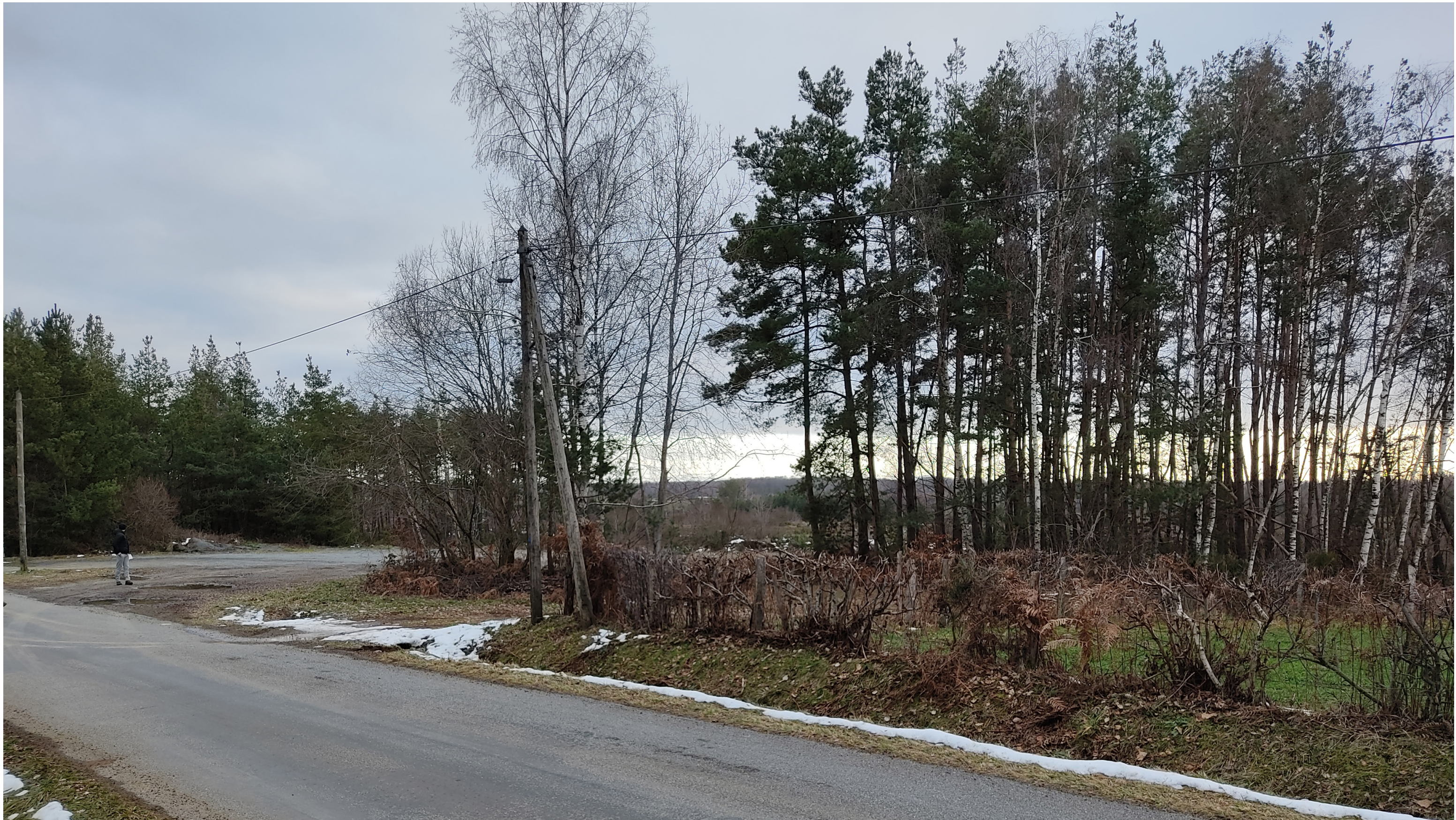
Point de vue N°1- depuis la route départemental n°105 à l'ouest de l'AEI