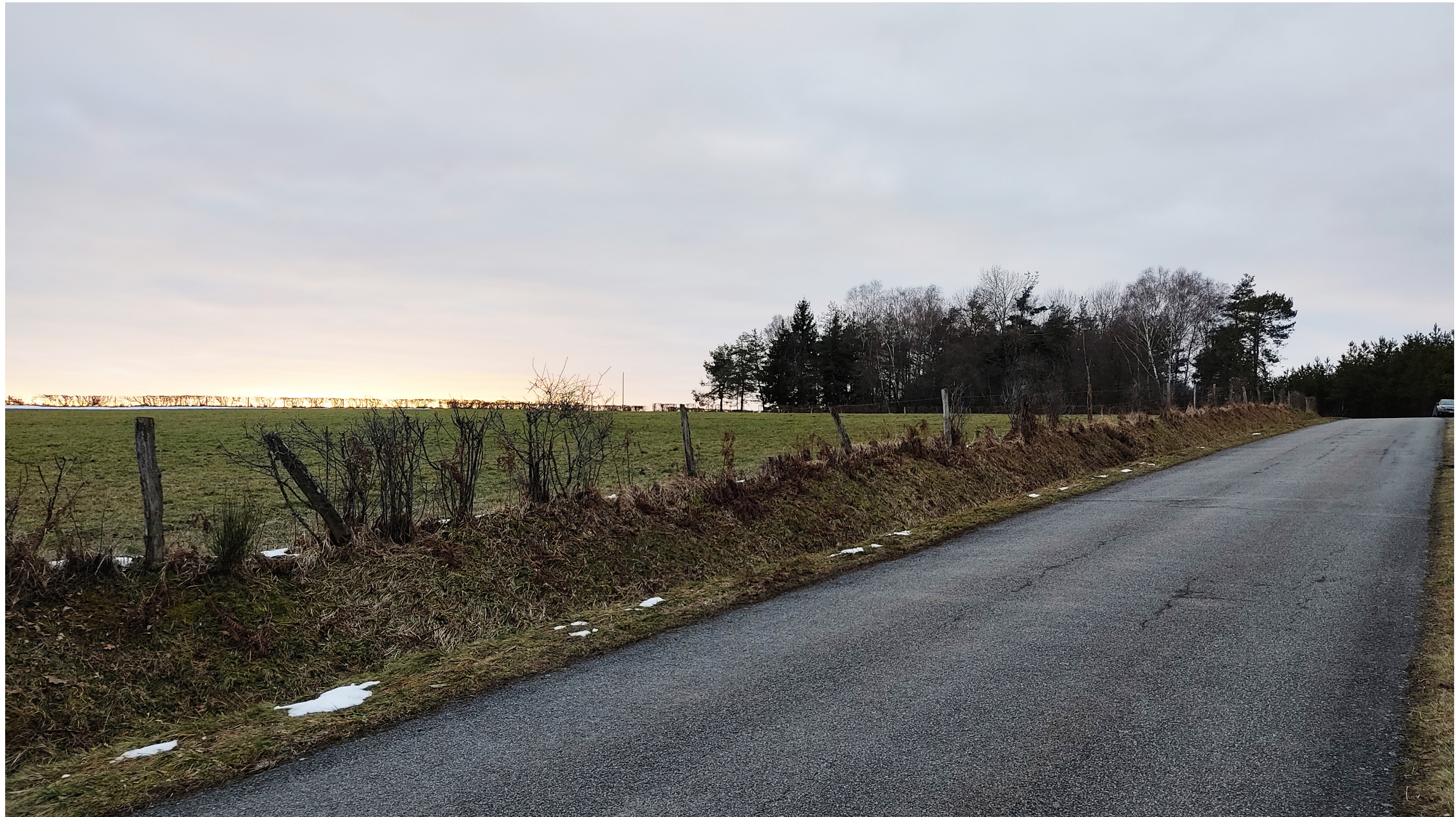
Point de vue N°6- depuis la route départementale n°105