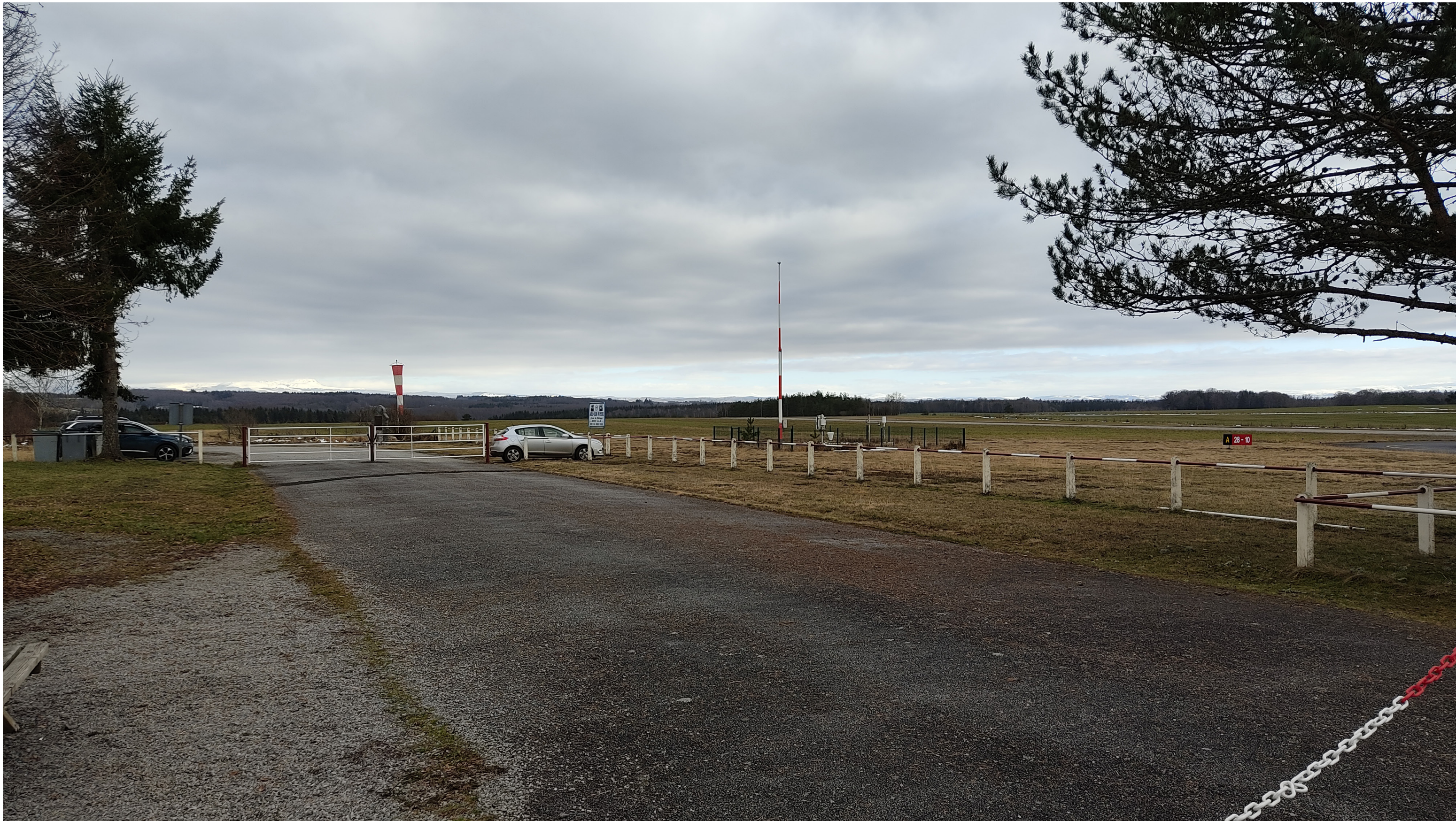
Point de vue N°3-depuis la stèle à proxemitté de parking de l' aérodome