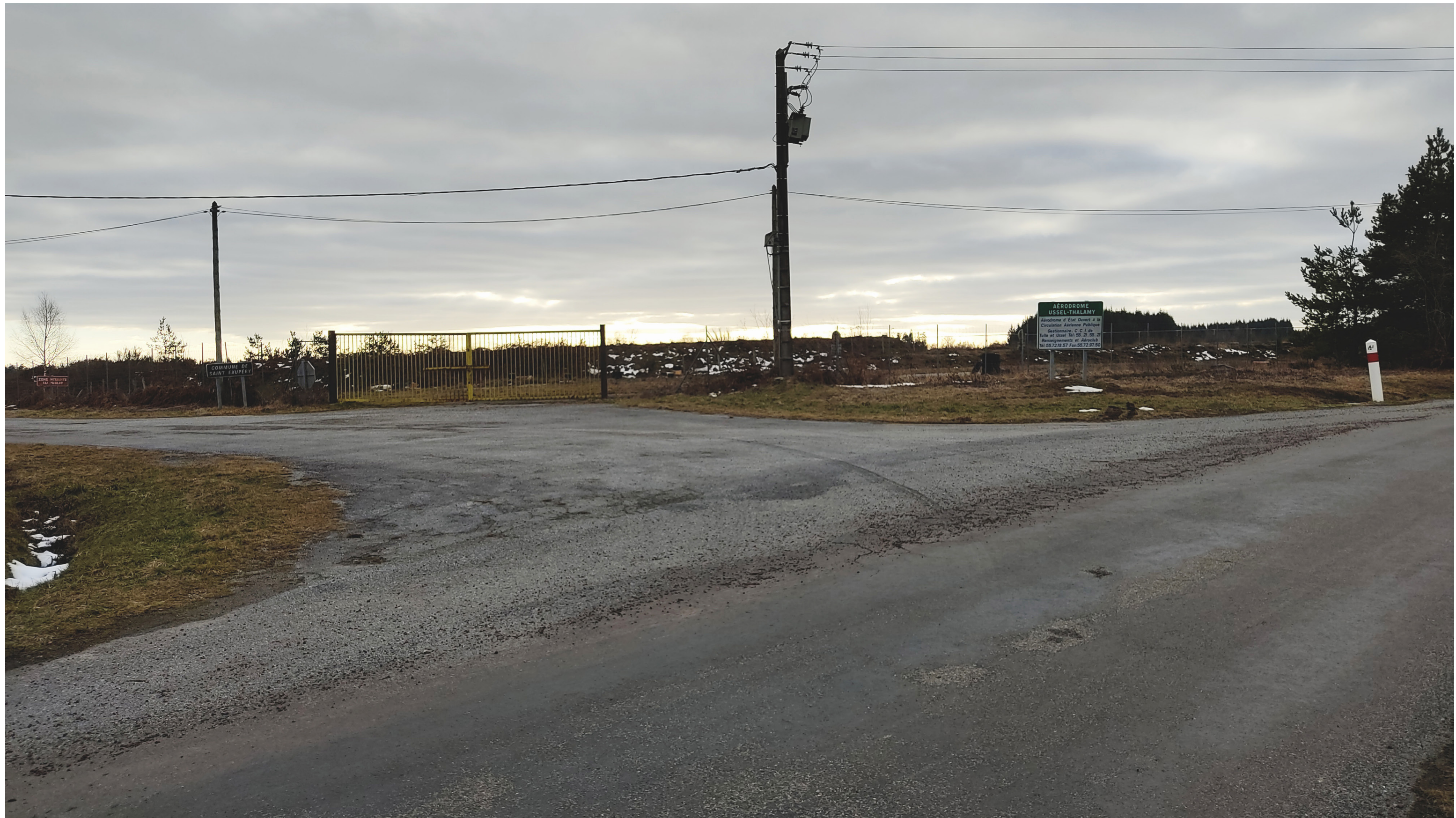
Point de vue N°2- depuis l'entrée de l' aéroport