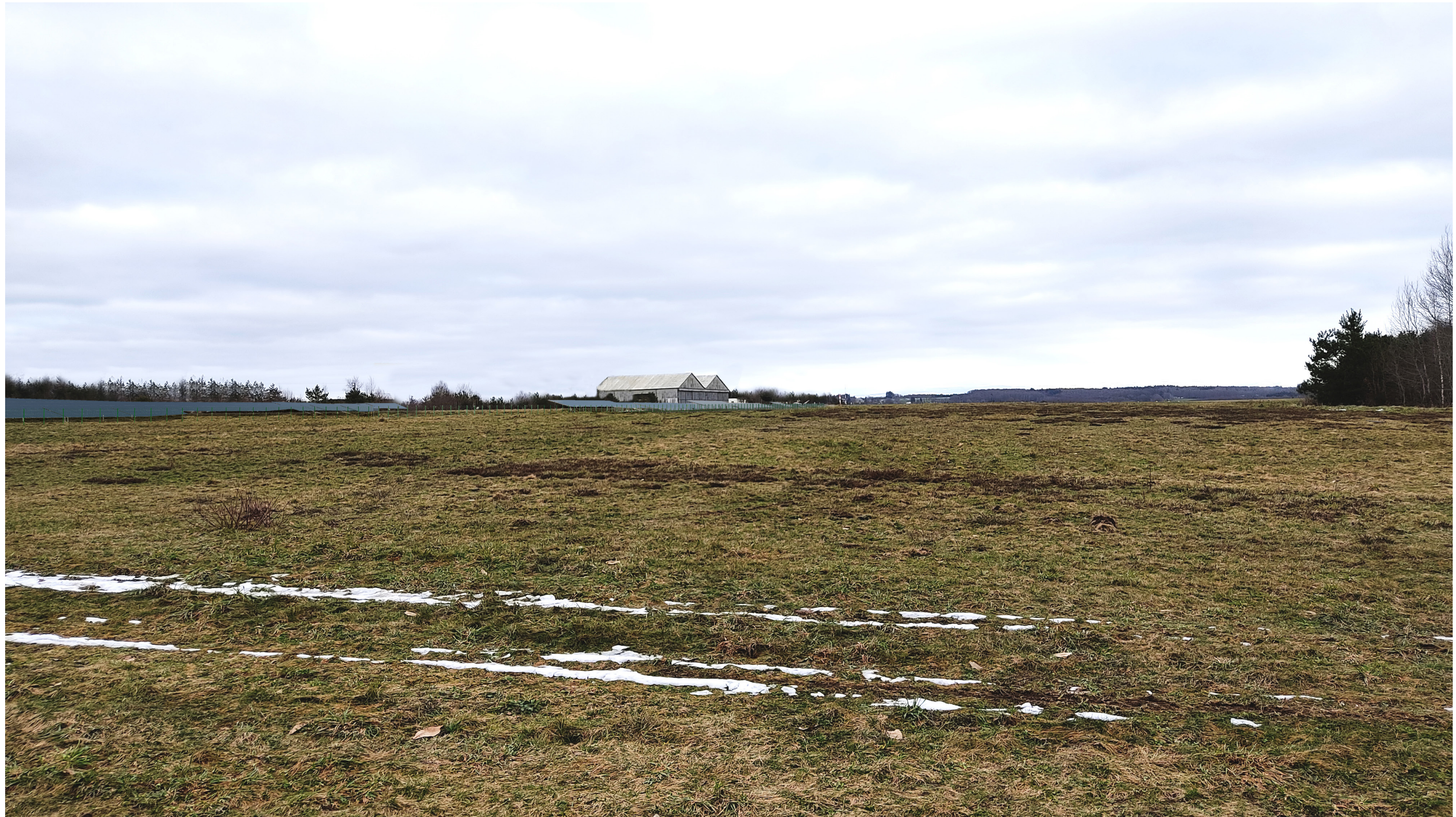
Point de vue N°5- depuis le chemin de randonnée à l'ouest de l'AEI