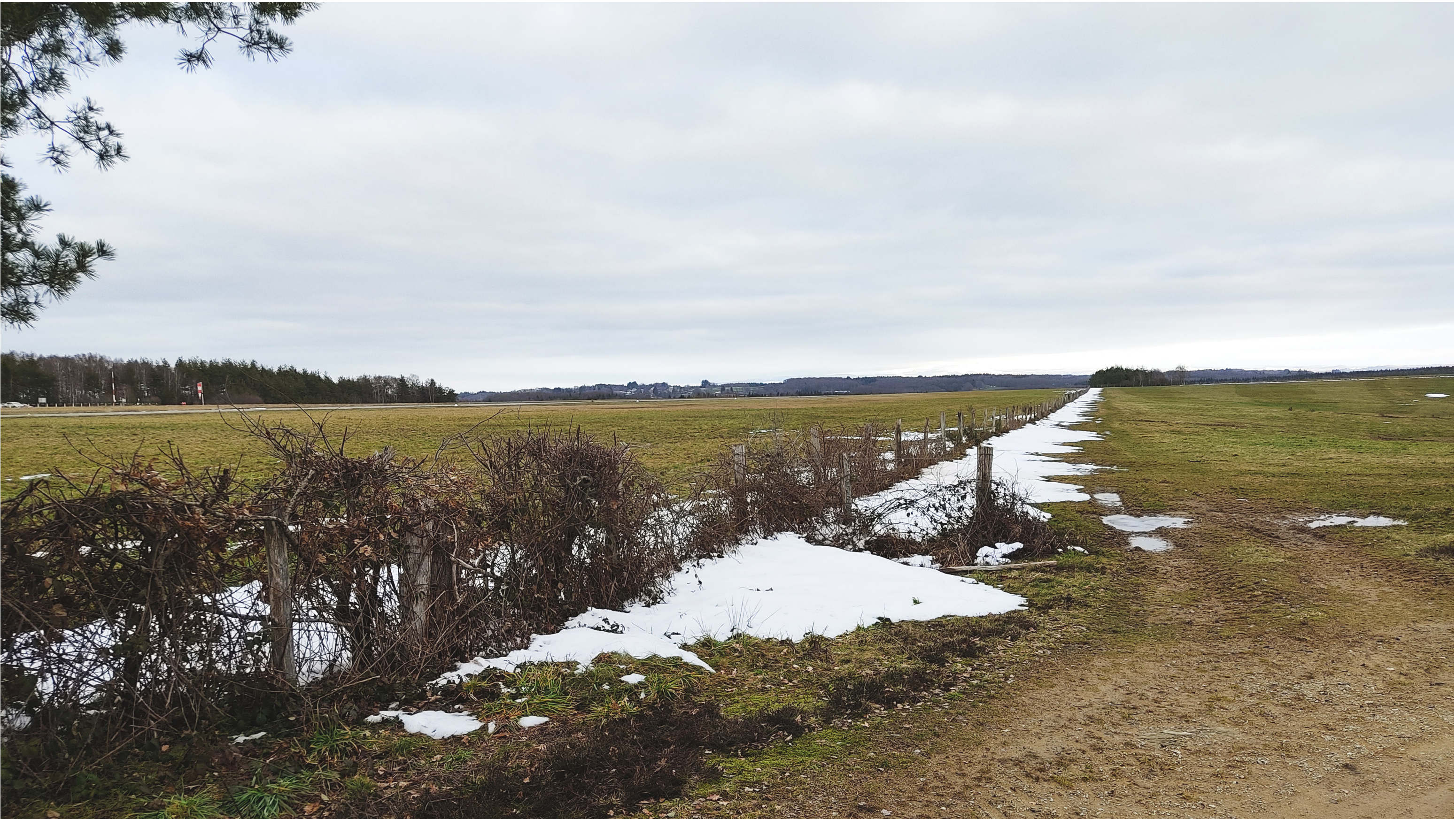
Point de vue N°5- depuis le chemin de randonnée à l'ouest de l'AEI